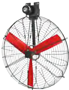
VENTILATEUR PANIER DE RECIRCULATION