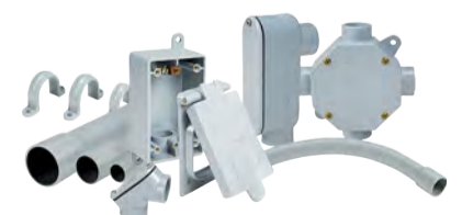
RACCORDS ET ACCESSOIRES ÉLECTRIQUES