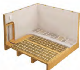
SÉRIE OWC-M (INSTALLÉ)