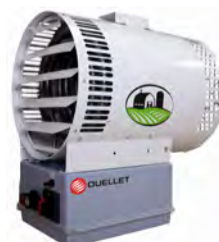
AÉROTHERME AGRICOLE LAVABLE