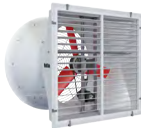
VENTILATEUR ENTRAÎNEMENT DIRECT (V-FAN M, 240V)