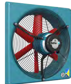
VENTILATEUR D'ÉVACUATION AVEC MOTEUR ÉCONERGÉTIQUE (240V)