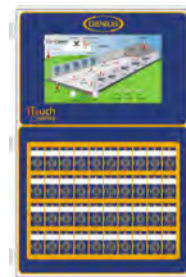
ITOUCH RÉGULATEUR INTÉLLIGENT MULTI ZONES